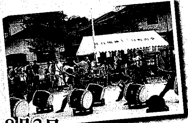
8月3日 井口明神一丁目