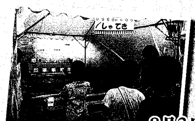
8月3日 井口明神三丁目